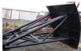
Vanne aqueduc déposée (en 2009)