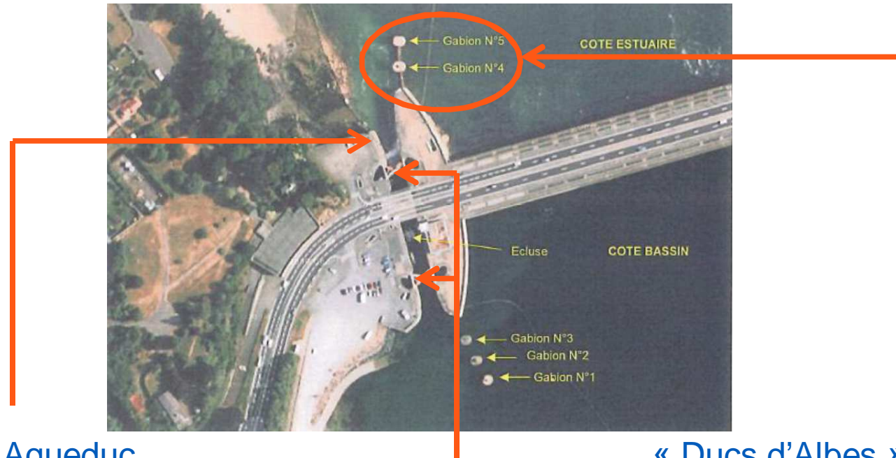
Vannes Aqueduc côté Mer